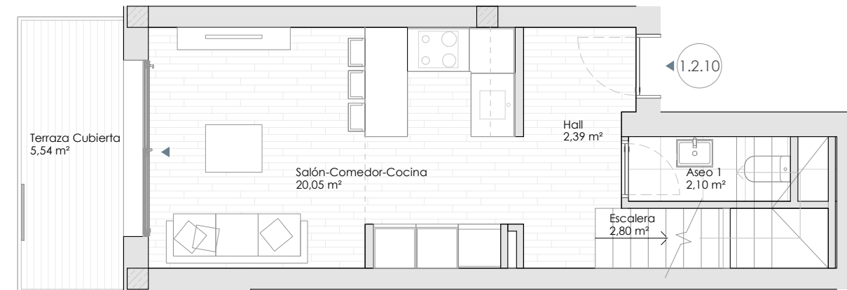
Planta Segunda. Acceso vivienda